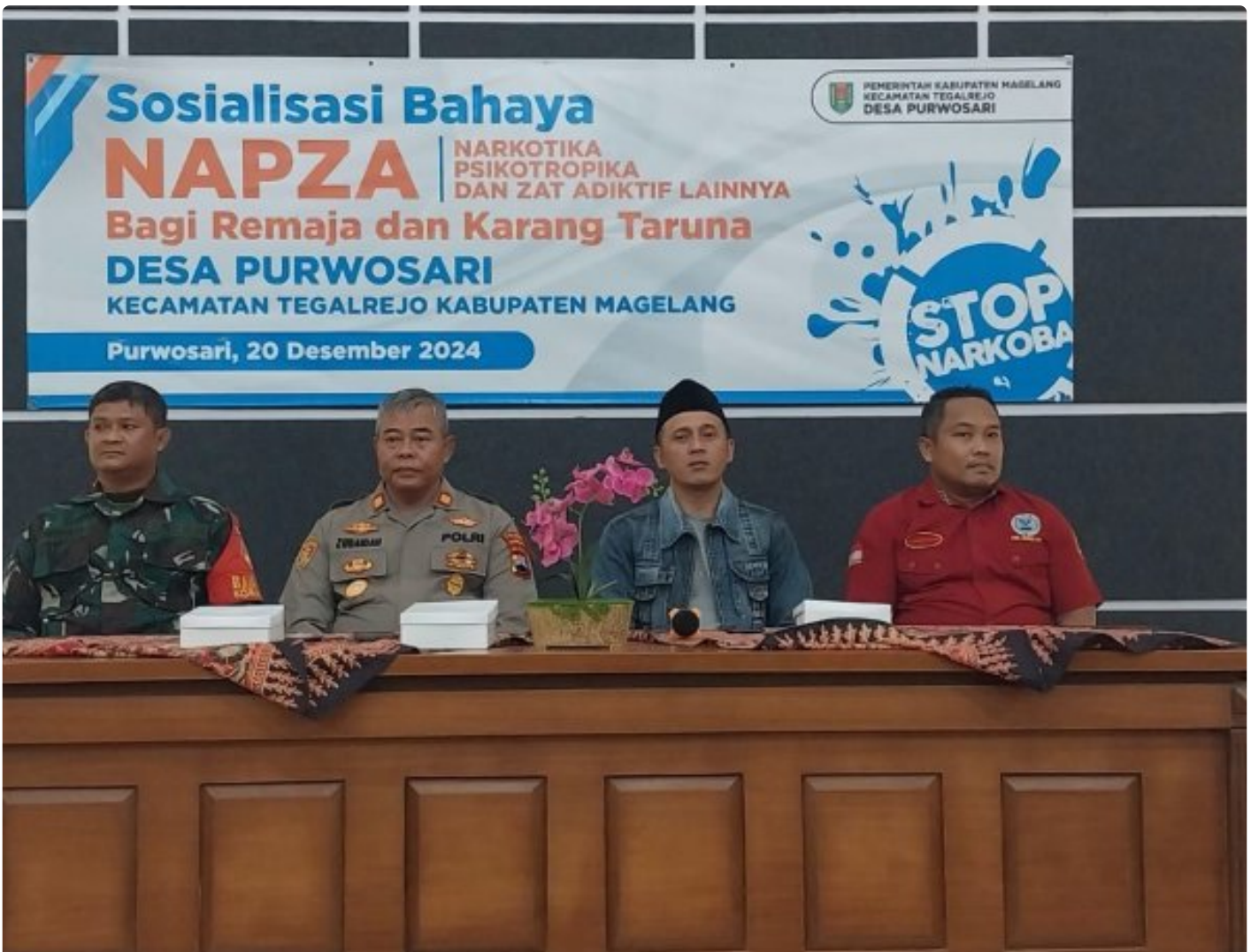
(Foto Dokumen) : Kegiatan sosialisasi bahaya narkoba dan kenakalan remaja

MAGELANG - Anggota Koramil 09/Tegalrejo bersama Polsek setempat dan anggota BNN memberikan sosialisasi tentang bahaya narkoba dan kenakalan remaja kepada anak-anak remaja Karang Taruna Desa Purwosari, Kecamatan Tegalrejo. Jum'at (21/12/2024).